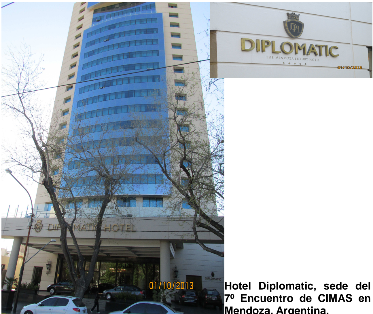
Hotel Diplomatic, sede del 7º Encuentro de CIMAS en Mendoza, Argentina.