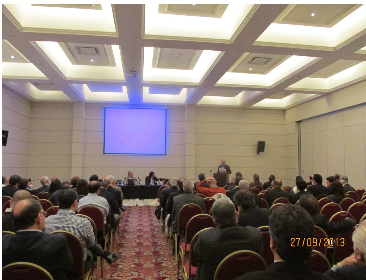
Vista de la sala de conferencias durante el desarrollo del Coloquio de CIMAS

Las Síntesis de los Temas de Estudio , elaboradas por sendas Comisiones de Trabajo que resumieron los intercambios efectuados, más los aportes efectuados en el Plenario, se pueden apreciar en Anexo 2 .